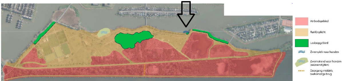
Afb. Aanwijzing hondensloopgebieden Diemerpark (2023)

Deze plek staat ook in de publicatie 'Aanwijzing hondensloopgebieden Diemerpark':