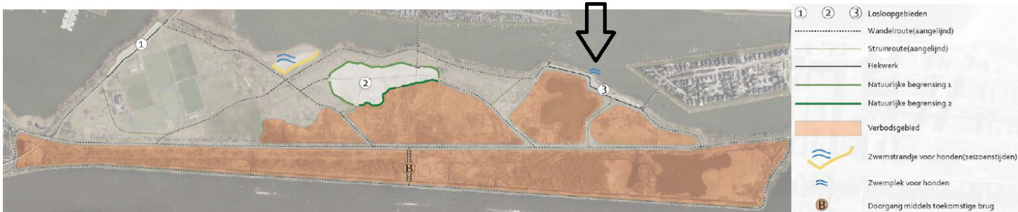
Afb. uit deelplan 'Hondenlosloopgebieden' (2020)

Hieronder staat de afbeelding die in dit citaat wordt genoemd. De zwarte pijl hebben wij toegevoegd. Deze verwijst naar een voorziene losloopplek rechts van de steiger die het water in steekt.