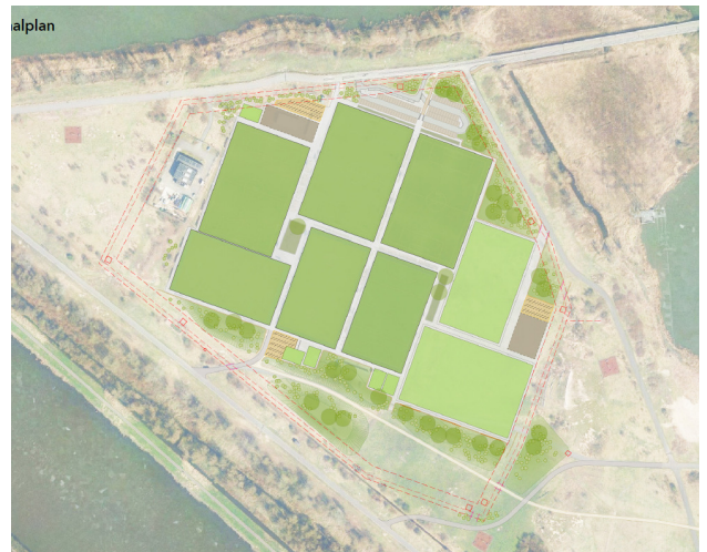
Sportterrein conform het plan van het Dagelijks Bestuur van 11-01-2023 8