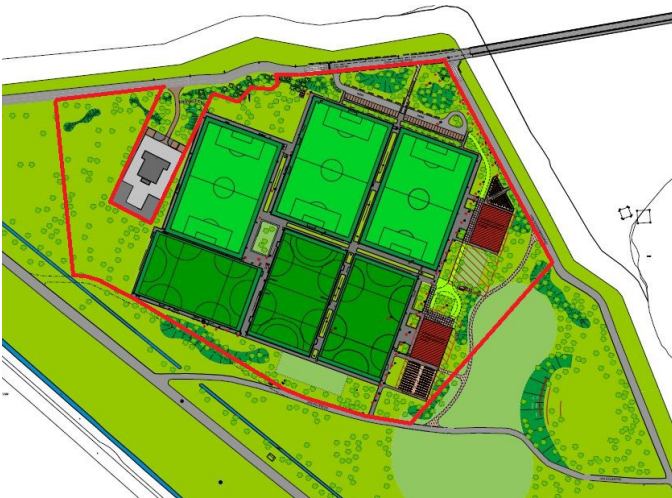
Sportterrein binnen de grenzen van het bestemmingsplan (rode lijn), zoals vastgesteld door de bestuurscommissie Oost in 2014 7

Met onderstaande afbeeldingen willen we aantonen dat niet alleen het 'oude' plan van uitbreiden van sportvelden tot 10 of 9,5 velden, maar ook het onlangs in een 'technische' sessie aan de stadsdeelcommissie gepresenteerde plan voor uitbreiding van de sportvelden niet past binnen de grenzen van het bestemmingsplan.