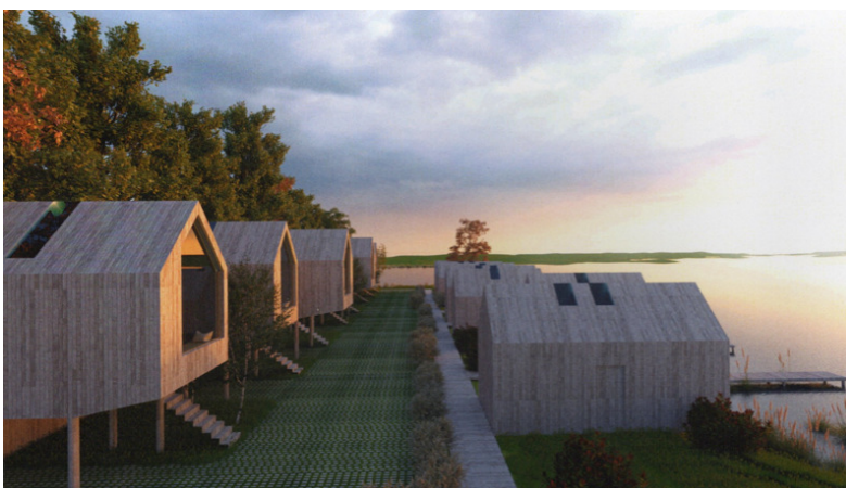
↑ Impressie van de 'short stay' huisjes