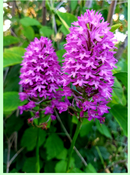
Hondskruid (juni 2022)