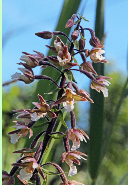
Moeraswespenorchis (juni 2022)