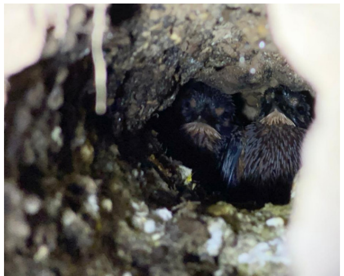
Jonge ijsvogels in het nest (juni 2022)