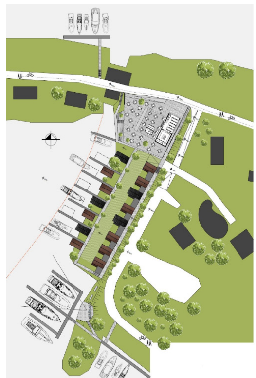
↑ Kaartje van het plan. Bovenin de Diemerzeedijk.

Deze laatste wordt gedacht op de plaats van de huidige onbewoonbare woning.