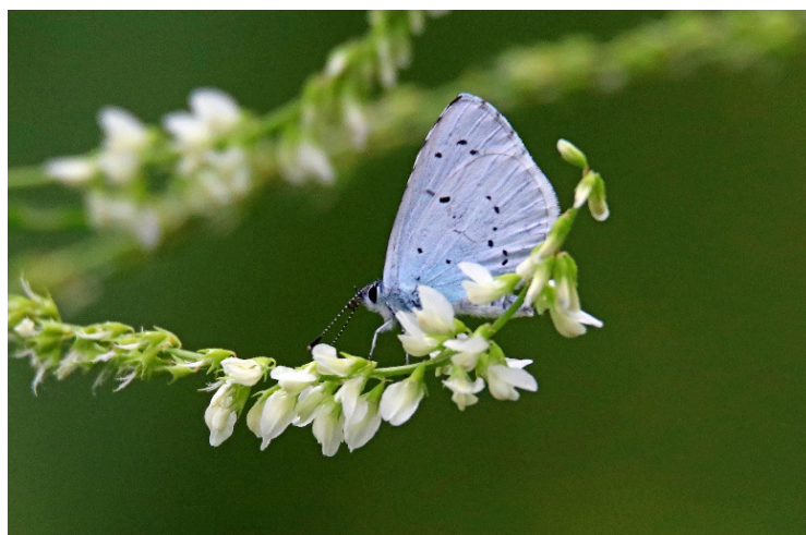
↑ Boomblauwtje (juli 2022)

Opmerkelijk waren de 2 Boomblauwtjes, waarvan vóór 2022 maar 3 keer een exemplaar in het Diemerpark gesignaleerd is.