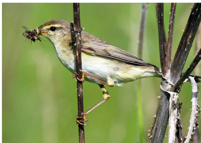
↑ Fitis met voer voor de jongen in het Diemerpark

Verder merken we graag op dat het Diemerpark veruit het grootste aantal rodelijstsoorten vogels telt van alle Amsterdams parken, namelijk Dodaars (3 territoria), Snor (1), Kneu (1), Koekoek (3), Matkop (2), Nachtegaal (16!) en Spotvogel (6!).