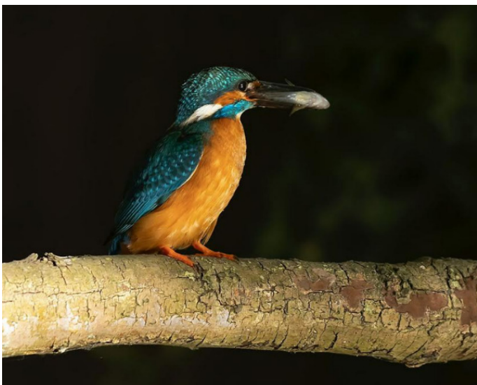
IJsvogel met een visje voor de jongen (juni 2022)

In tegenstelling tot 2021, was 2022 een goed ijsvogeljaar voor het Diemerpark. De ijsvogels die de korte maar hevige vorstperiode van 2021 in Amsterdam en omgeving overleefd hadden, of hun jongen, hebben dit voorjaar de twee kunstbroedwanden in het park ontdekt en er succesvol in gebroed. Zowel in de broedwand in Akkerswade als in een andere kunstwand hebben we tijdens onze inventarisaties jongen aangetroffen.