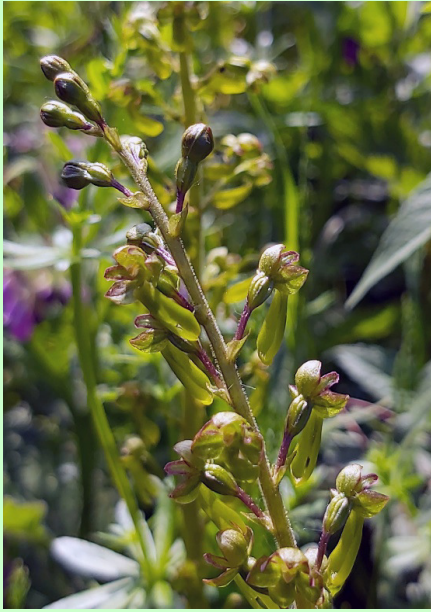
Grote keverorchis (mei 2022)

Dit jaar konden we ons opnieuw verheugen in een zeer grote diversiteit aan orchideeën: Rietorchis, Gevlekte rietorchis, Brede wespenorchis, Moeraswespenorchis, Hondskruid (ook Pyramideorchis genaamd) en Grote keverorchis.