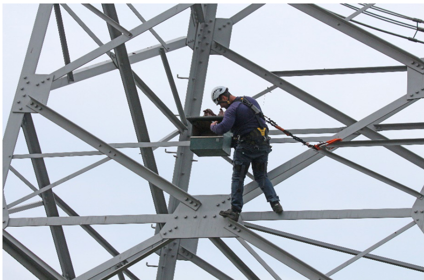
↑ Nestmateriaal vervangen in de torenvalkkast (september 2022)

In september is dat gebeurd, en we hebben goede hoop voor volgend jaar: geregeld zien we een of twee torenvalken in en rond de kast. Zal een paartje besluiten hier volgend broedseizoen zijn jongen groot te brengen? We zijn benieuwd!